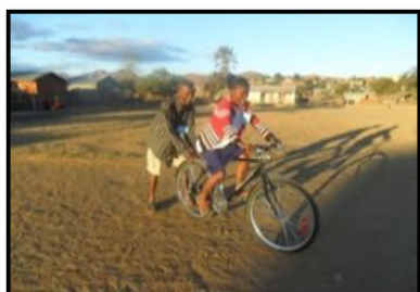
Apprentissage du vélo

Ce n'est pas facile de faire de long trajet à vélo seule dans les zones reculées, pour faire les visites de ses « patients » ou pour déposer les rapports d'activités aux supérieurs hiérarchiques. Certaines ont dû commencer par apprendre à monter à vélo. Elles s'impliquent cependant avec beaucoup de volonté et d'abnégation, tout en soulignant qu'elles interviennent en tant que bénévoles.