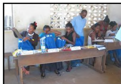
Vérification des kits de réparation