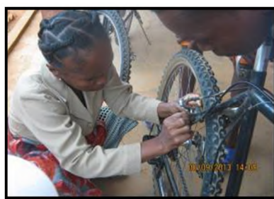
Entretien et réparation du frein (remplacement du patin)