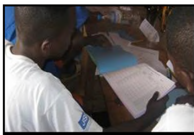
Registre de gestion du vélo