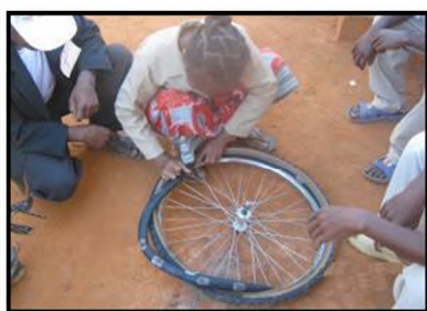
Réparation de crevaison