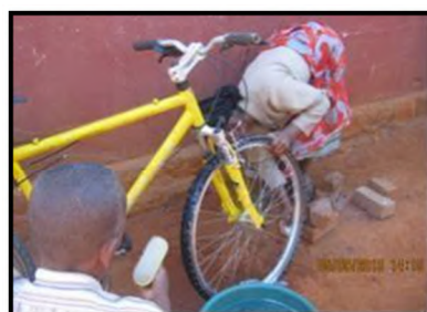
Entretien quotidien de la bicyclette