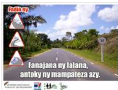
Affiche géante posée à la clôture du projet pour perpétuer la sensibilisation.

Nombreux accidents dus aux excès de vitesse et aux stationnements dangereux. La plupart des usagers font des arrêts fréquents entre Brickaville et Toamasina dans les villages où les activités économiques sont intenses (marché, lieu de restauration, points d'évacuation des cultures de rente, etc.).