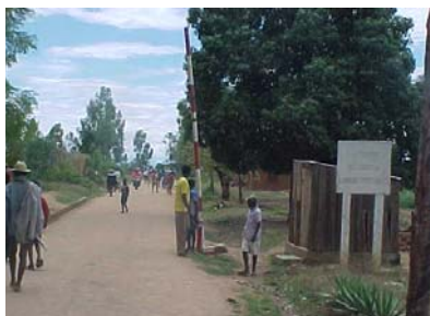
La barrière de pluies protégeant le tronçon récemment réhabilité a été instaurée avant les autres.

Les résultats attendus de l'appui de l'ONG Lalana étaient :